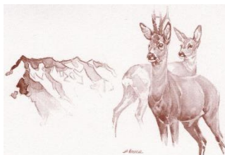
Jägersektion Falknis BKPJV

Samstag, 3. Mai 2025 08.00 - 12.00 Uhr 13.00 - 16.00 Uhr