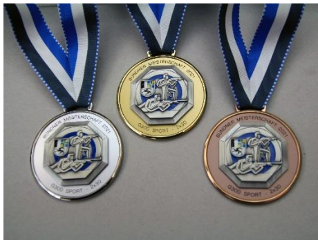
Gold, Silber und Bronze nicht nur an der Olympiade in Tokio, sondern auch an der Bündner-Meisterschaft auf dem Rossboden in Chur.